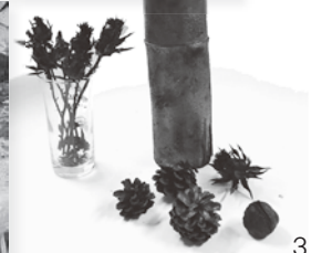
1_顔を真っ赤にしながら炭出しをする子どもたち 2_ていねいに飾り炭づくりをする参加者 3_松ぼっくりやクルミのほか、紅花や折り鶴といった“変わり種”もきれいな炭になった