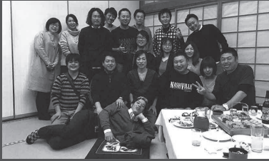
平成9年度卒同級白鷹東中3-4同級会

若者達が実施するふるさとの良さを再確認する機会となる同世代の交流会等の開催を応援する事業です。