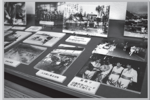
白鷹町なつかし写真展