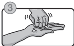
指先・爪の間を念入りにこすります。