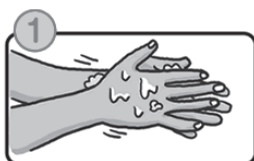
流水でよく手をぬらした後、石けんをつけ、手のひらをよくこすります。