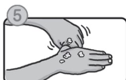
親指と手のひらをねじり洗います。