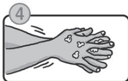
指の間を洗います。