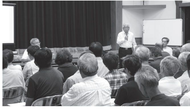
昨年度の座談会の様子

町長、副町長、教育長、町の課長などが各地区にお伺いし、「まちづくり座談会」を開催します。 今年度の座談会では、将来のまちづくりに対しご意見をいただき、白鷹町のまちづくりの総合的な指針となる第6次白鷹町総合計画（平成32年度～平成41年度）策定の参考にさせていただきます。