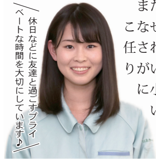
休日などに友達と過ごすプライベートな時間を大切にしています。

製造業をやってみたいと思い、美容師からの転職を決意。女性の多い職場で、働きやすい環境が整っていると感じ、当社への入社を決めました。私が担当している製品は手のひらサイズのコンパクトなもので、それをピンセットを使って組み立てています。小さな部品を扱う細かい作業で、立ち仕事という点では大変ですが、仕事自体はそれほど難しくないので、誰でも安心して働ける会社だと思います。