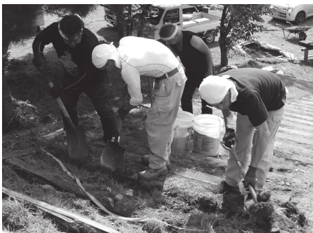
蚕桑小学校グラウンドにある 滑り台の枕木を整備する建設組合員

これは同組合により毎年行われているもので、本町では鮎貝、蚕桑小学校及び白鷹中学校の3校で実施されました。主に音楽準備室の棚修繕（白鷹中）やブランコの安全柵設置（鮎貝小）、滑り台の枕木整備（蚕桑小）などを実施していただき、組合員の方は「安全な遊具で思いっきり遊んでもらいたい」と笑顔で汗を拭きました。ありがとうございました。