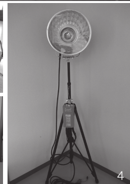
1_クイックテント 2_折りたたみイス 3_ワイヤレスアンプ 4_投光器