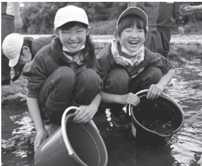
1匹1匹をやさしく川に放流しました

近年、カワウやブラックバスなどによる食害により、鮎の漁獲量が減っていることが大きな問題となっています。今年は、日本一のヤナ場に多くの鮎がかかってくれることを願います。