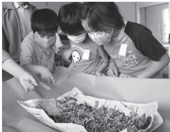
蚕をじっくり観察。少し早く脱皮した蚕が動いていました

今後は、くわかけ、ひき拾い、まゆかき、糸取り（操糸）といった工程を児童たちが体験していきます。また、採取した繭は、繭細工や6年生が卒業式に身に着ける桜のコサージュなどに使用されます。