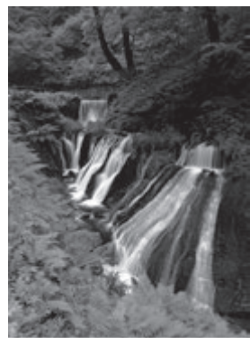
丸山純二「滝と緑の別天地」