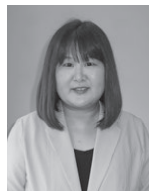
生活支援コーディネーター

生活支援コーディネーターが、高齢者の方や、地域の方などにお伺いし、お話をお聞きする機会があると思いますので、どうぞよろしくお願ひします。