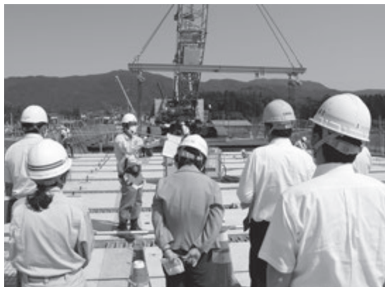
工事施工中の様子を見学しました

また、新橋梁の名前についても町民への公募などを行った結果、「 しらたかおおはし 白鷹大橋」に決定しました。経済、交流、物流の拡大に向けて重要な役割を果たす「白鷹大橋」。完成および開通までもう間もなくです。