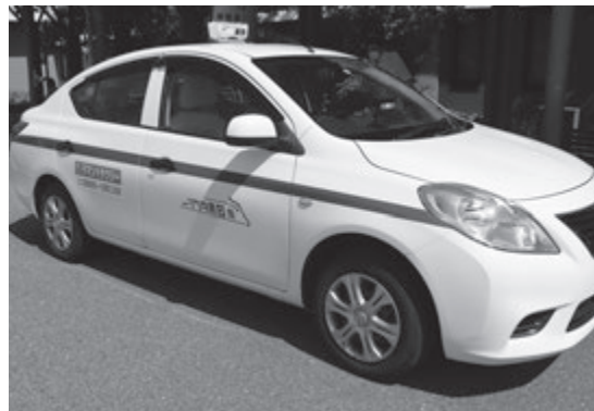
公立置賜総合病院に向けて出発しました

実証実験期間は11月末を予定しています。ぜひご利用いただき、さまざまな意見をお聞かせください。