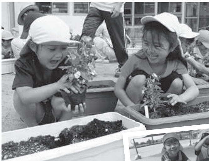
なかなかうまくカップが取れず▲ に困った様子の園児 お花を上手に植えられました!▶

サルビアやニチニチソウといった色とりどりの花に目を輝かせる園児たち。ひとりひとりにプランターが準備され、お気に入りの花を3株植えました。カップがなかなか取れずに困った様子の園児もいましたが、みんなで協力し合いながら全員がオリジナルの寄せ植えプランターを完成させました。園児たちからは「とても楽しかった」「毎日ちゃんと水を上げます」と感想が聞かれ、これからもお花に愛情をたっぷり注いでいくようです。