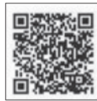
ホームページ QRコード