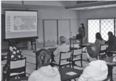
中国文化サロンの様子

これからも引き続き中国文化サロンを開催し、日中の文化交流活動を行いたいと思います。どうぞ、よろしくお願いたします。