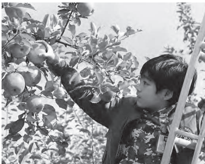
真っ赤に実ったりんごをひとつひとつ丁寧に摘み取りました

児童たちは、9月に葉摘み作業を行った際に、絵や文字を書いて作成したオリジナルシールを貼り、そのりんごをめがけ一目散に走りだし、真っ赤に実ったりんごに白く浮き出た模様を見て「すごい！ちゃんと絵になっている！」と大はしゃぎでした。一本の木からおよそ400キロものりんごを収穫。最後に、もぎたてのりんごを頬張ると「甘くて美味しいね」「皮ごとたべるととっても美味しいよ」と、ともに作業を行った仲間たちと喜びを分かち合いながらいただきました。