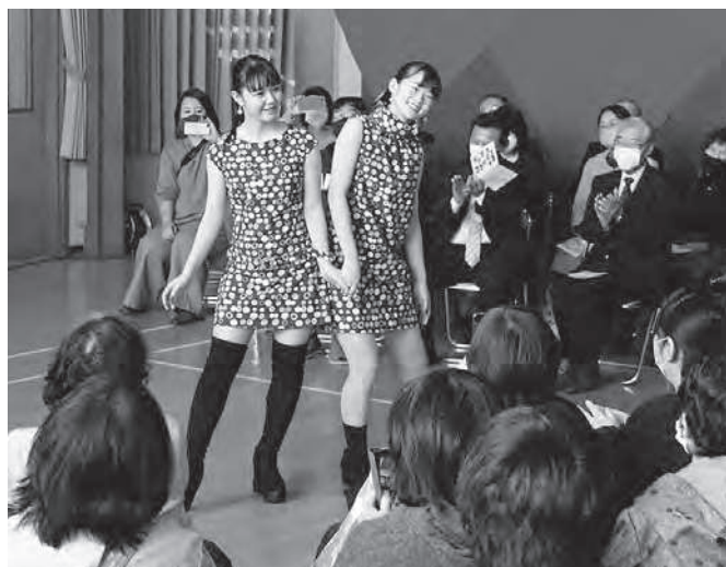
華やかな衣装に、会場からは大きな拍手が沸きました

例年であれば、町民の方もお招きして多くの方々に披露できたファッションショーも、今年は新型コロナウイルス感染症の影響で規模を縮小した形での開催となりましたが、生徒たちは思いを込めて作り上げた衣装を着て、堂々と会場を歩き会場を沸かせました。ファッションショーを終えた生徒たちは、達成感に満ち、とても明るい表情を浮かべていました。