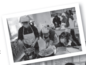
◀事前学習の様子。火加減や炒め方などたくさん学びました ▼「とても上手に作れました」と笑みを浮かべる児童

今年の弁当の日は11月16日に実施され、児童たちは、自ら献立を考えながら材料の調達、調理、後片付けを行いました。早起きして弁当を作った児童たちは、「料理がすごく楽しかった。今度は家族にもお弁当を作ってあげたい」と話しました。