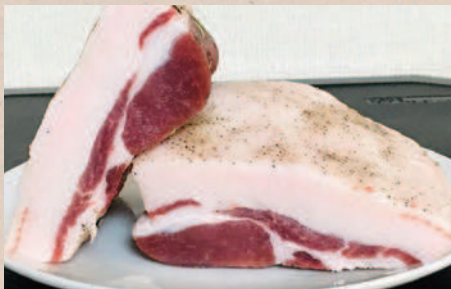
猪肉のパンチェッタ（塩漬け肉）

区で農業法人さんの畑や田んぼで農作業をメインに活動させていただきました。その中で、秋から寒くなるにつれ、目につくようになったのがイノシシなどの害獣による農作物への被害です。お世話になっている農業法人さんの畑や田んぼ以外にも多くの田畑が被害に遭いました。個人としては罫免許を取得し、猟友会の人たちの協力のもと、イノシシを捕まえることが出来ましたが、山中にはまだまだ多くの害獣がいるので、この害獣被害対策として地域全体で何か出来ないかなと思っています。