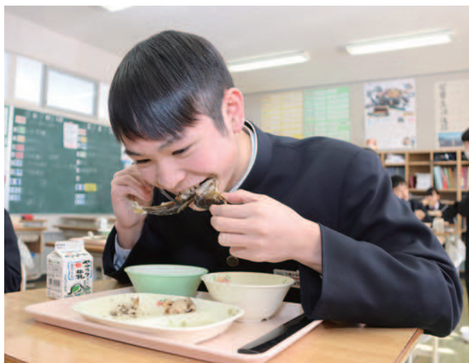
ふっくらした鮎の塩焼きにかぶりつく生徒

毎年この時期になると、高校受験を控えた3年生の生徒に、進路実現に向けて頑張ってもらいたいと思いを込めて、あゆ茶屋より「勝ち関鮎 どき 」と称し町の魚である鮎の塩焼きが送られます。給食でいただいた生徒たちは、「私たちのために、応援の思いが込められた鮎をいただいてとても嬉しいです。この思いを力に変えて、入試に向けてしっかりと勉強を頑張っていきます。」と話しました。これから、受験を控えている皆さん、体調管理に気を付けて頑張ってください！