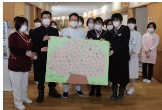
白鷹中学校生徒会と医療従事者の皆さん

白鷹中学校の生徒たちが書いた応援メッセージは、白鷹町立病院のほか、公立置賜総合病院と公立置賜長井病院の2つの医療機関にも届けられました。