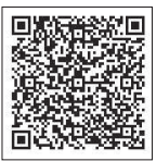
視聴はコチラから

※当日、健康福祉センターすこやかホールで上映します。参加希望の方は、3月18日(木)まで地域包括支援センター係へお申し込みください。