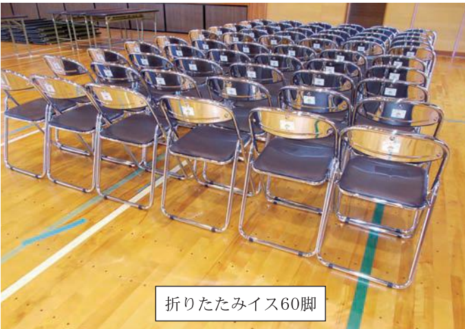
折りたたみイス60脚