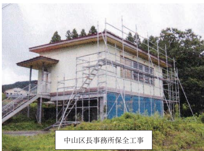
中山区長事務所保全工事