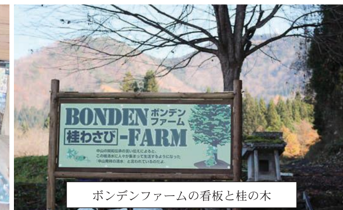
ボンデンファームの看板と桂の木