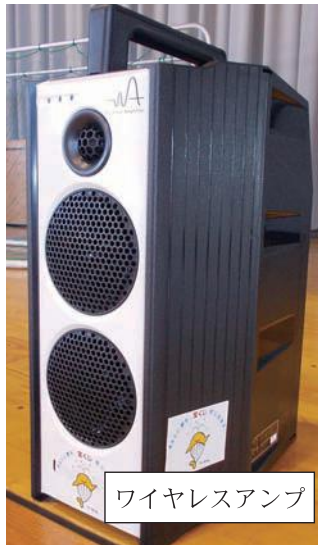
ワイヤレスアンプ