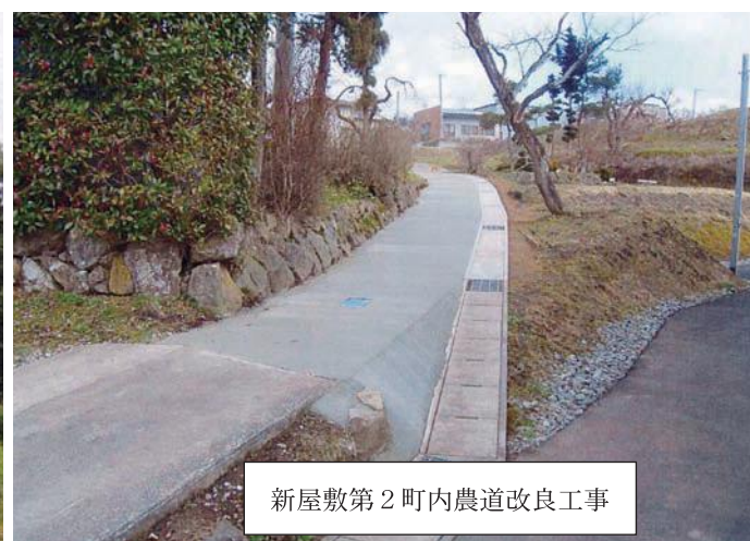
新屋敷第2町内農道改良工事