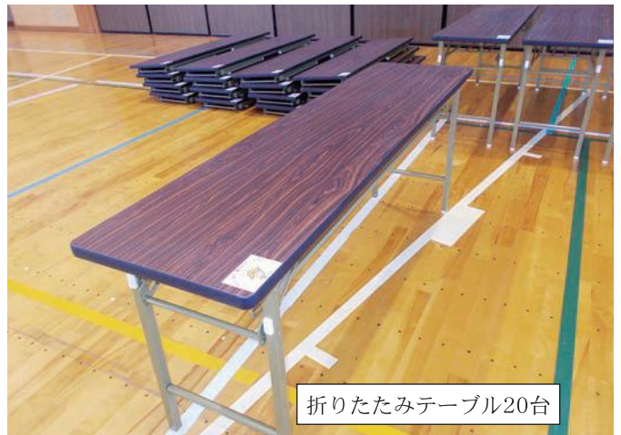
折りたたみテーブル20台