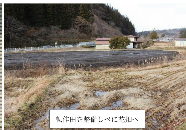
転作田を整備しべに花畑へ