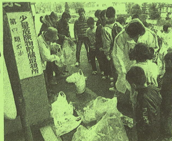
拾ったゴミを分別する子どもたち