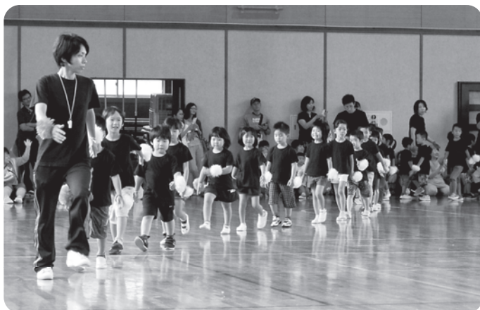
年中・年長児が一生懸命にお遊戯を披露してくれています。今年も楽しみです。 (昨年写真から)