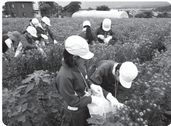
「一学期のワンシーン～紅花摘み」

四月五日にスタートした一学期も、七月二十五日で終了です。この一学期を振り返り何よりうれしく思うのは、大きな事故やけがなどがなく、全員元気に過ごすことができたということです。く中略く みなさんに一つお願いがあります。この一学期、いろんなことにがんばってきたみなさんですが、何もしないで放っておくと、せっかく光り輝いていた部分の輝きがなくなってしまうです。光り続けるためには、自分を磨いておかなければなりません。