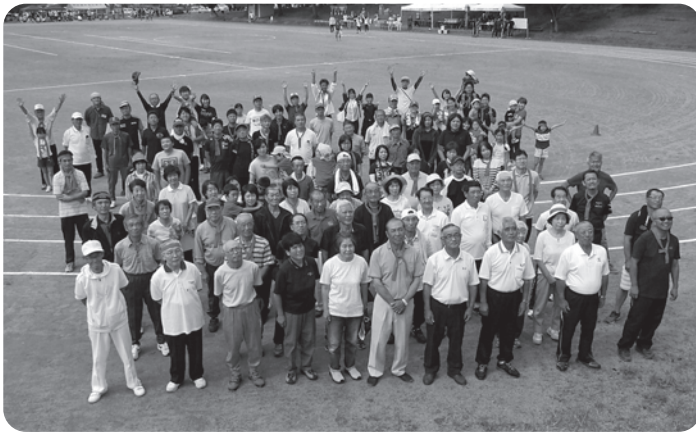
見事に三連覇を達成された赤組の皆さん、おめでとうございます。 (組毎に撮影した集合写真から)