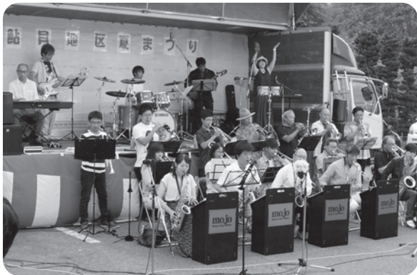
ジャズオーケストラバンドMOJO(モジョ)にオープニングを飾っていただきました↑

また、売店コーナーにも多くの方々に出店していただいたおかげで、充実した内容で楽しいひと時を過ごしていただけたのではないのでしょうか。ご協力いただいた皆様にお礼申し上げます。