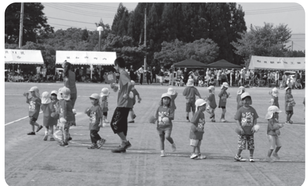
今年は3才児も加わり、かわいらしい園児たちが元気いっぱいの踊りを披露してくれました。

更には、大会に華を添えていただいた保育園の先生と園児たち、懇親会にお酒を提供していただいた加茂川酒造様、大変お忙しい中、ご協力いただいた大会役員や分館長、分館役員の皆さんにも感謝申し上げます。