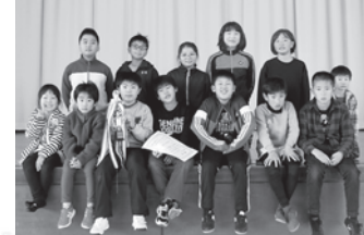
↑準優勝 小山沢子ども会

優勝 杉沢チーム 準優勝 小山沢チーム 第3位 浅立ちチーム 第4位 町下チーム 第5位 広野チーム