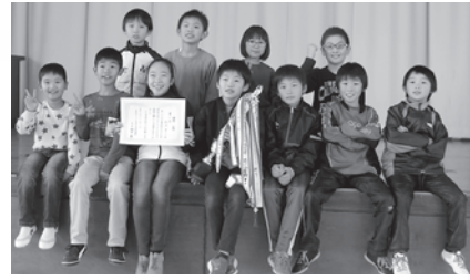
↑優勝 杉沢子ども会

寒い中、ご参加、ご協力いただきました参加者の皆さん、育成会の役員の方々、本当にありがとうございました。