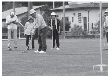
職場体験の中学生が撮った グラウンドゴルフ大会の写真