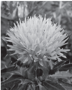
今年も美しい紅花をめざして

また、今年度から新たに2名の方が部会に加わっていた、たくさんになりました。産業環境部会は農作物栽培を主に行うことから、活動が天候に左右され、作業日数も多くなります。関わって下さる方が増えることは本心に心強く、ありがたいことです。仲間と知恵を出し合いながら、実りの季節をめざし、今年度も活動を頑張ります。