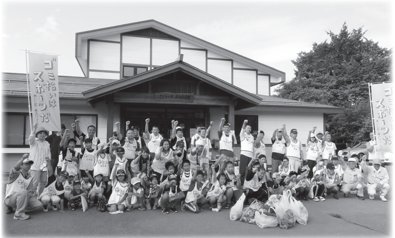
スポーツゴミ拾いに参加した人々