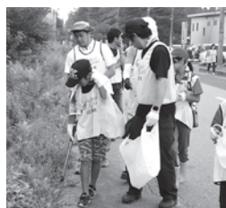
歩いてみると落ちてい るゴミに気づきます。