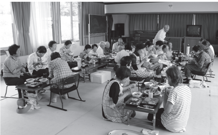
にぎやかに懇親会