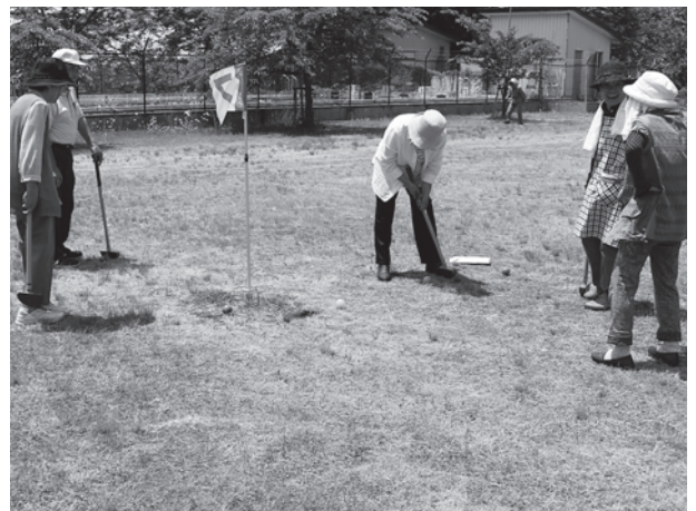
結果は入りました！！