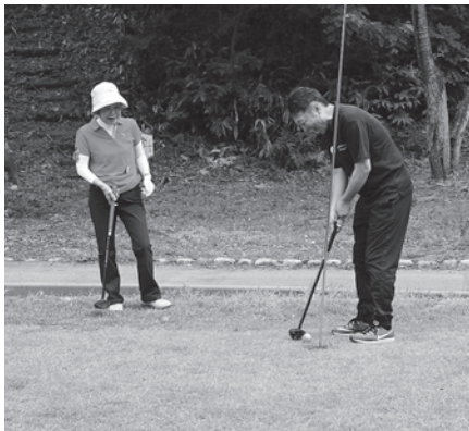
(パークゴルフ) やっと入るぞ

大会として開催の予定をしておりましたが、まだプレーを行ったことがない方も多く体験会として開催し、「あじさい、べにばな」の2コースを回りました。グラウンドゴルフと違った感覚のプレーを楽しみました。体験会の結果(総打数)