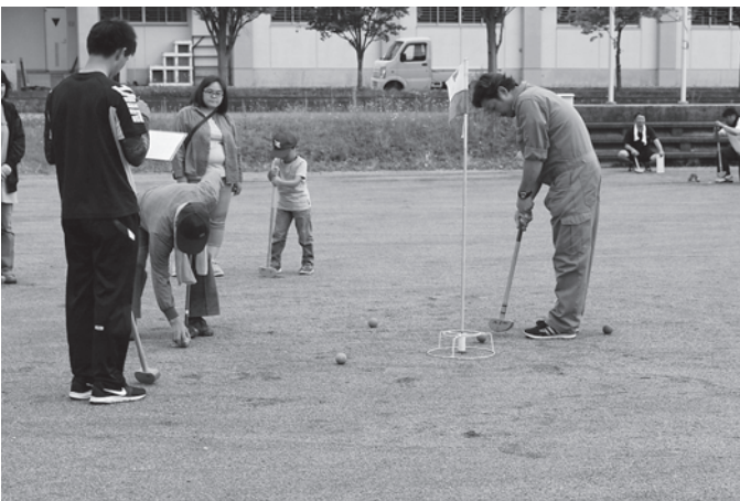
近くとも入らない!(Gゴルフ)