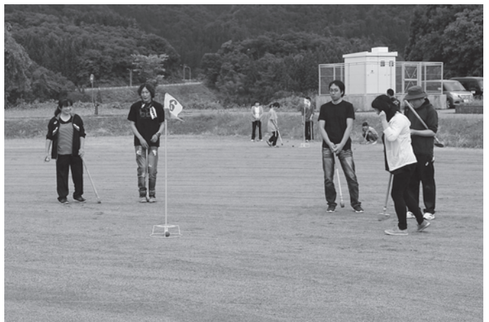
入った小さくガッツポーズ!!! (Gゴルフ)