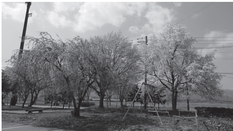
東根コミセン駐車場前