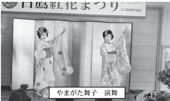
やまがた舞子 演舞