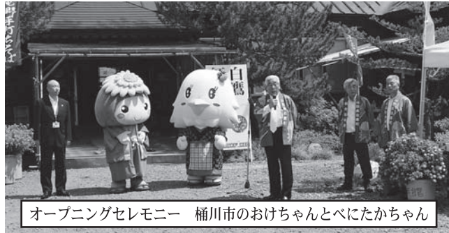
オープニングセレモニー 桶川市のおけちゃんとおべにたかちゃん