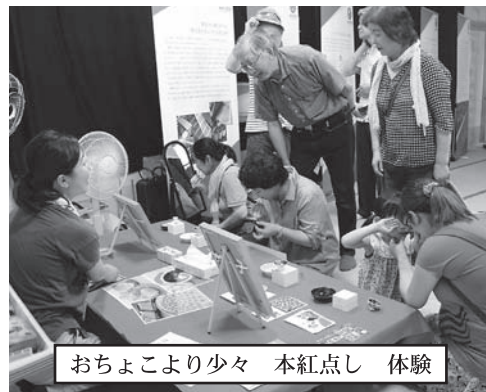
おちょこより少々 本紅点し 体験