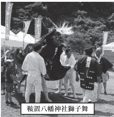
鞍置八幡神社獅子舞