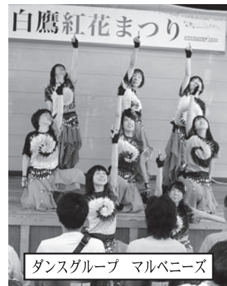
ダンスグループ マルベニーズ