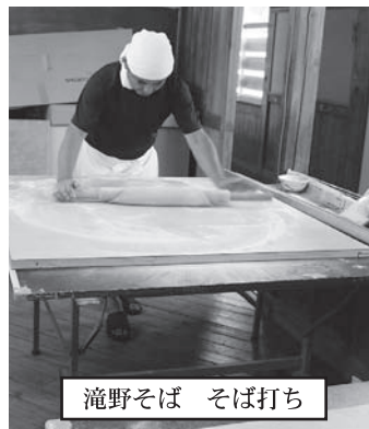
滝野そば そば打ち