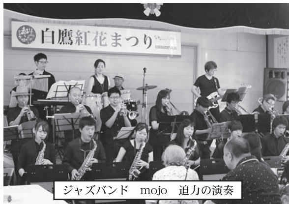
ジャズバンド mojo 迫力の演奏