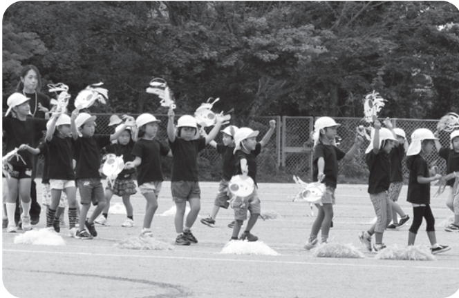
年中・年長児が一生懸命にお遊戯を披露してくれています。今年も楽しみです。 (昨年の写真から)