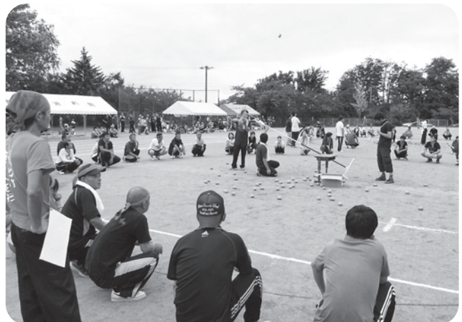
恒例の『まり入れ』は人数制限がありませんので、ぜひご参加いただいて、チームに貢献しよう!

レク大会は、鮎貝地区の方々が一堂に会して、交流と親睦を深めていただくイベントの一つとして開催していますので、貴重な休日かもしれないかもしれませんが、ぜひご参加いただき、半日楽しんでください。