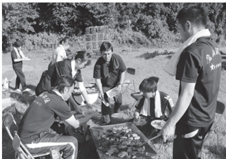
お疲れ様 焼肉で反省会