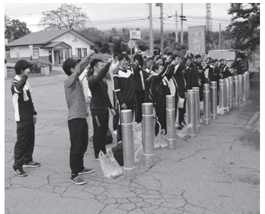
鷹山コミセン前で出発式