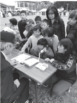
災害伝言ダイヤルと消火器体験

10月15日（日）には白鷹町防災訓練に、子ども教室鷹山会場として参加し地域の大人と一緒に、様々な訓練を行いました。子どももきちんと防災の知識を持ち、自分の命は自分で守るということを再認識しました。