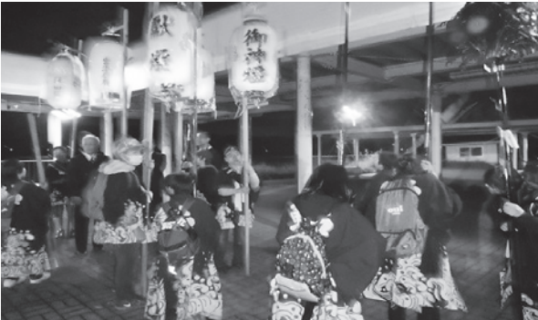
高張り (10/9宵宮祭の七五三獅子舞)