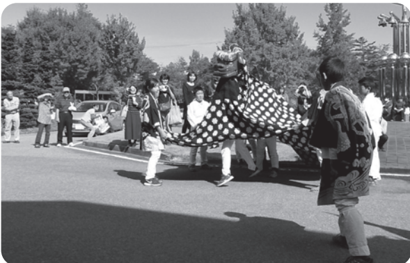
創設46年の伝統ある子獅子連の獅子舞子どもたちがいきいきと輝いていました