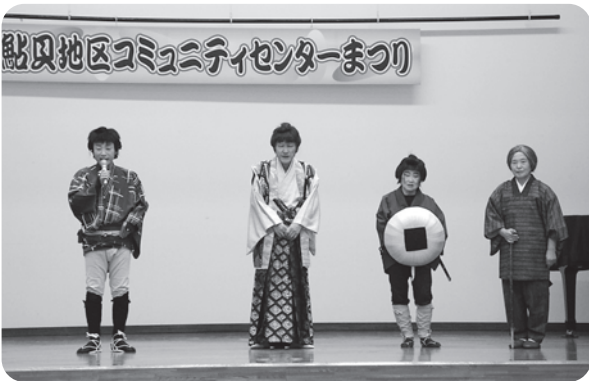
敬老会などでも引っ張りだこの股旅舞踊わかば会のみなさん