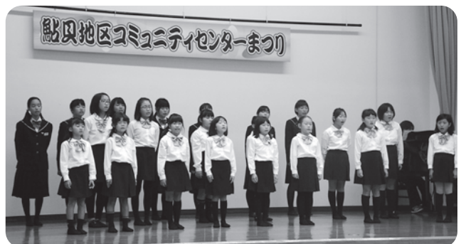
素敵な歌声で心を和ませてくれた少年少女合唱団