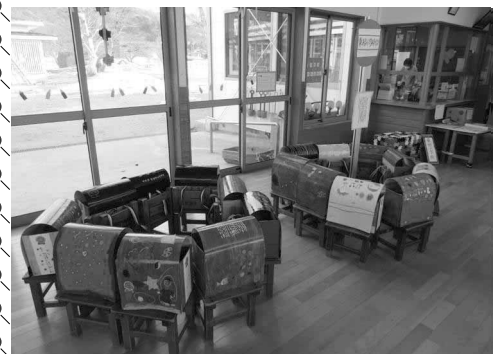
ひまわり組 ランドセル