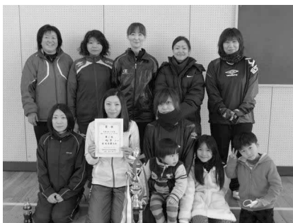
優勝した町下チームの皆さん！

優勝を勝ち取ったのは、男女とも町下チーム。ダブル優勝おめでとうございました。参加された選手の皆さん応援団の皆さんお疲れ様でした。