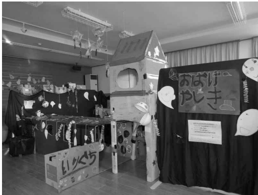
ばなな組 おばけやしき

去る2月13日から15日までひがしね保育園で作品展が開催されました。子ども達が力を合わせて一生懸命に作った作品は、楽しくてアイデアがいっぱい、ご覧になられた皆さんが笑顔になる素敵な作品展でした。