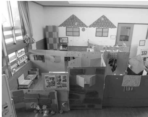
みかん組 ブレーメンのおうち