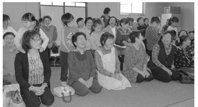
園児に肩をもんでもらってご満悦のおばあちゃんたちです

今月の19日に十王地区コミュニティセンターで行ったエコドライブ教室には多くの方に参加していただきありがとうございます。今後とも未来の子どもたちに美しい郷を残すためみなさんのご協力をお願いいたします。