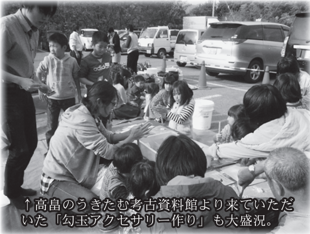
↑高島のうきたむ考古資料館より来ていただ いた「勾玉アクセサリ作り」も大盛況。

また、今年の日玉と して炊飯器で作った 芋風ふかし芋を無料 ふるまい。うまいね と大盛況でした。準 とから片付けました。 お手伝い。3日間 お手伝いの習・た ミセンの生涯習・た 育部の中心とした 事の皆さん、東西 に感謝申し上げます。