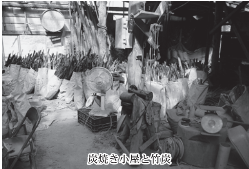
炭焼き小屋と竹炭