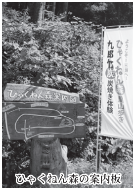
ひやくねん森の案内板