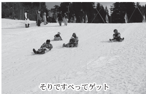
そりですべってゲット