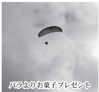
パラよりお菓子プレゼント