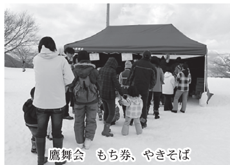
鷹舞会 もち券、やきそば