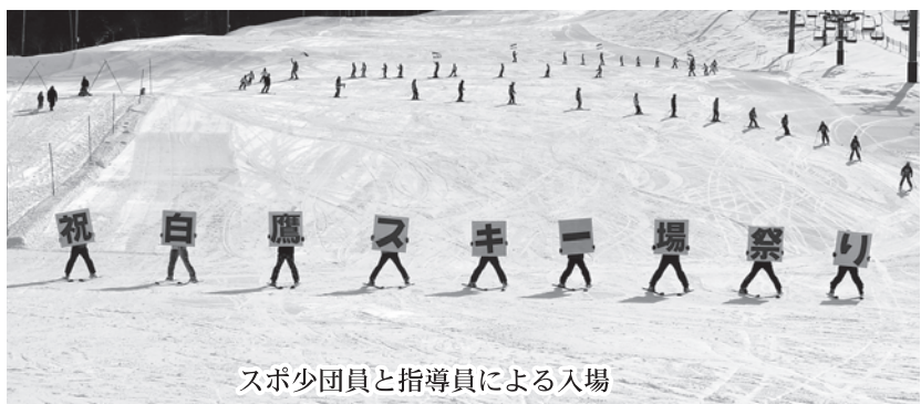
スポ少団員と指導員による入場

甘酒、牛乳の振舞い、豚汁、鷹舞会の焼きそば、中山各町内の餅つきの餅は早めに終了し、また、抽選会には長蛇の列ができて途中で賞品がなくなるなど、盛況の中でスキー場まつりが終了しました。