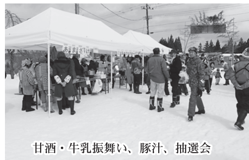
甘酒・牛乳振舞い、豚汁、抽選会