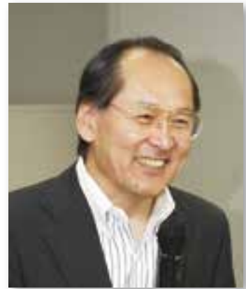
白鷹町振興審議会 会長

最後になりましたが、振興審議会の委員をはじめアンケート調査などご協力いただいた町のみなさんには感謝申し上げます。と同時に、向後の「まちづくり」に積極的に関わっていただくことをお願いして かくひつ 擱筆したいと思います。