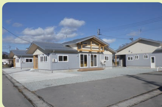
今後も増設される子育て支援住宅