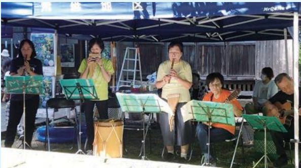
フォルクローレ愛好会のみなさんの演奏♪ ♪ケーナの音色で会場はとてもいい雰囲気