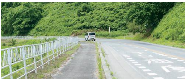
荒砥方面に向っての道路（車の所で衝突） カーブ注意の表示あり

7月6日（水）午前8時45分頃滝野交流館の西側、国道348号で車同士が衝突する交通事故が発生しました。幸い重大事故とはならず、3名が骨折などのケガとなりました。荒砥方面へ向かっていた軽乗用車が対向車線にはみ出し、山形方面に向かって走っていた乗用車と正面衝突したものでした。今回の事故の場所付近は何回目事故なのか？急なカーブとは感じられず通行しているが「魔のカーブ」となっています。