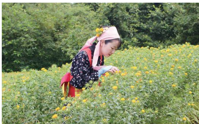
紅花娘をパチリ！ 7月17日撮影