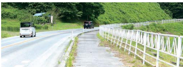
山形方面へ向っての道路 急カーブに感じない