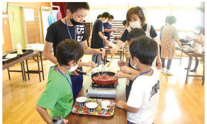
ひき肉を交代でまぜまぜ中