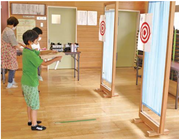
的当ゲーム中 輪ゴムの力あなどれず 以外に飛びます

7月16日(土)放課後子ども教室を開催しました。 工作は「的当ゲーム」の「ペットボトルのふた」を「輪ゴム」で飛ばす「用具」を作りました。皆さん上手に作り、近くから、遠くから飛ばして「的当」を楽しんでおりました。 その後、三食弁当を作り、挽き肉を炒め、そぼろ卵を作り、オクラを切り、きれいに弁当箱に並べました。一同に会して食べることはしないで持ち帰り、早めに食べるようにお願いしました。 コロナ感染予防を図り子ども教室を行ってまいります。