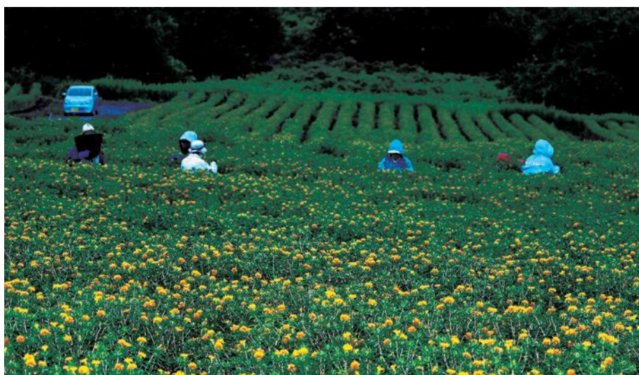
早朝からの紅花摘み 7月15日午前4時30分頃撮影