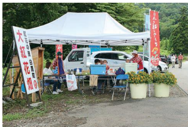
上原町内有志の売店7月17日撮影