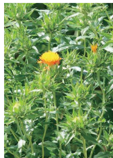
初めて発見紅花一輪 7月6日撮影