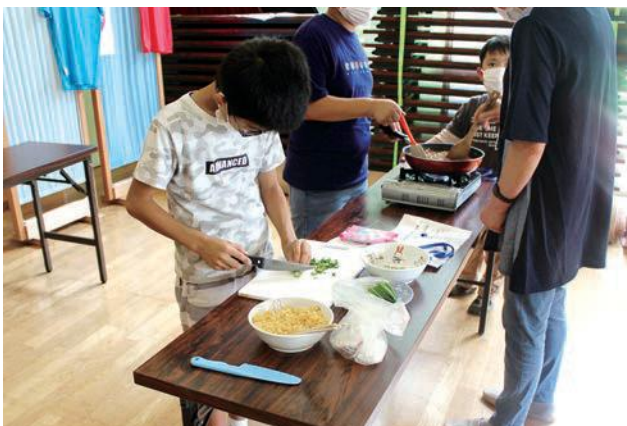
オクラを切ってます