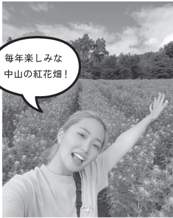
毎年楽しみな 中山の紅花畑！