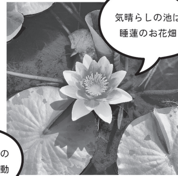
気晴らしの池は 睡蓮のお花畑