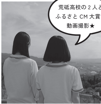
荒砥高校の2人と ふるさとCM大賞の 動画撮影★

年の梅雨は猛暑続きで雨がほとんど降らず、梅雨が明けたら一体どんな天気になってしまっただろうかと、とても不安でした。しかし梅雨明け宣言後は戻り梅雨のような天候が続き、とても涼しく「本格的な夏も余裕な気がする！」と思ったのも束の間、8月にかけてまた猛暑の日々が…。私は見かけによらず梅雨の次に暑さが苦手なため、なんとか夏バテしないように栄養バランスの良い食事を心がけています。 ただ、天気の良い日が多いので、白鷹の自然や景観の美しさに癒されています。7月は紅花やあじさいなど、たくさん花を楽しむことができました。