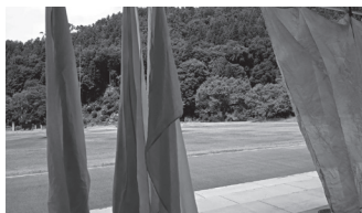
▲染色した木綿の乾燥