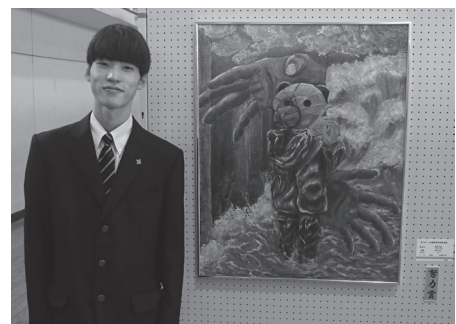
タイトル「怒気(どき)」