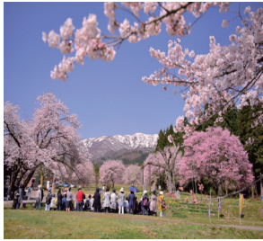
釜の越農村公園の桜群 旅先案内人によるガイド有