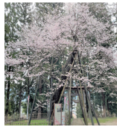
八乙女種まきザクラ