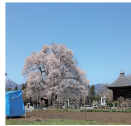
称名寺阿弥陀堂の桜