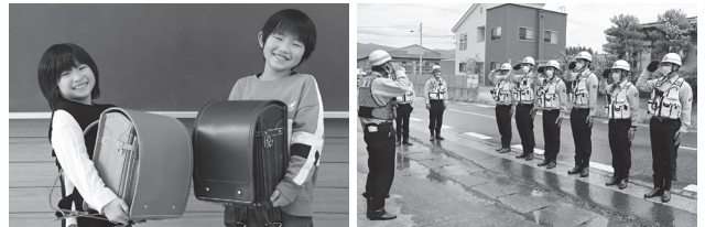
消防団、人材確保・報酬の拡充