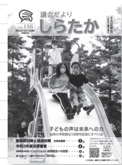
議会だよりしらたか