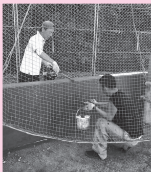
フェンスの塗装（白鷹中）

暑い中での作業となりましたが、児童、生徒のために丁寧に作業していただきました。本当にありがとうございました。