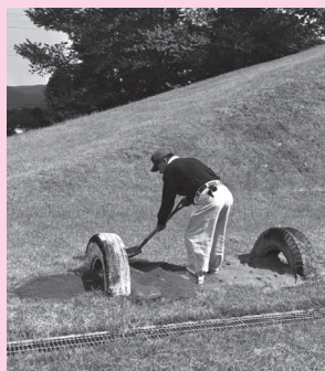
遊具への土盛り（蚕桑小）