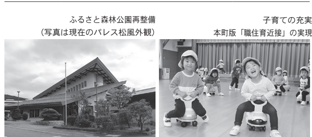
ふるさと森林公園再整備 （写真は現在のパレス松風外観）